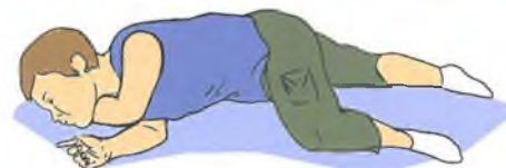
Устойчивое боковое положение