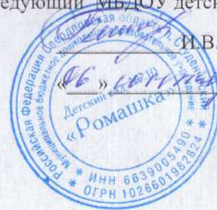
График организации подвоза воспитанников в МБДОУ детский сад №10 «Ромашка» в 2022/2023 учебном году

Маршрут п. Белореченский, ул. Уральская, 7 - п. Студенческий, ул. Лесная, 1а